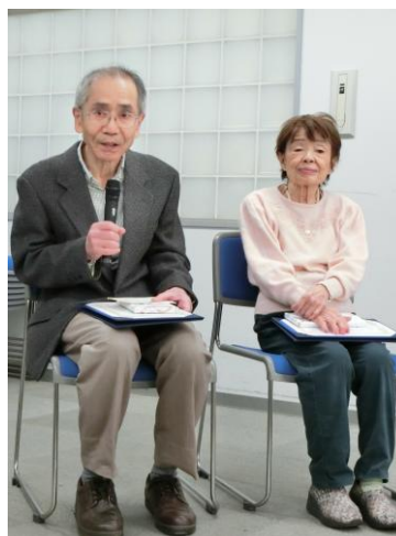
被表彰者から一言