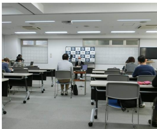
会場とオンラインの併用で開催しました