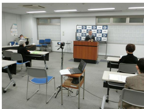
会場とオンラインの併用で開催しました