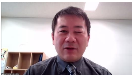
講演は盛り沢山の内容でお話しいただきました