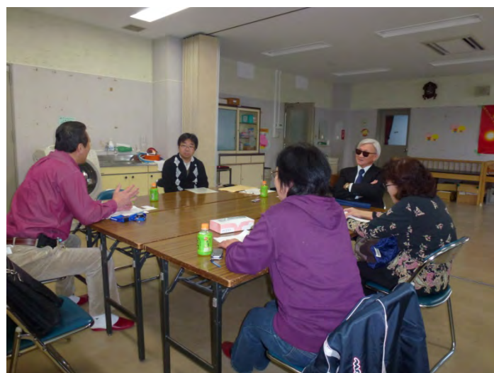
・宮城県ヒアリングの様子