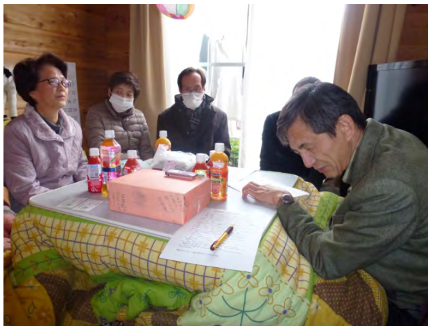
福島県ヒアリングの様子