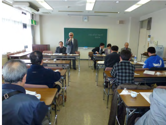
・岩手県ヒアリングの様子